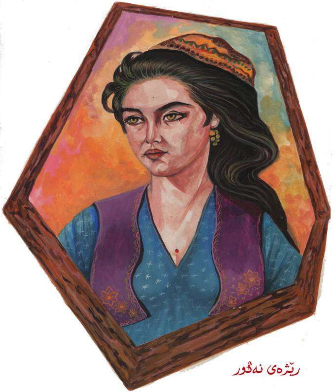
ریشہی نہ گور